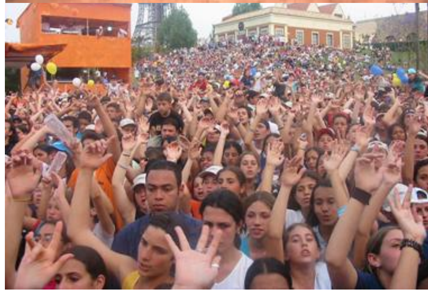
Coca-Cola - Funcionários