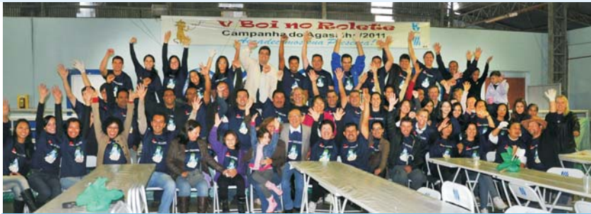
A animada grande equipe do Vale do Ribeira que trabalhou no Boi no Rolete de 2011