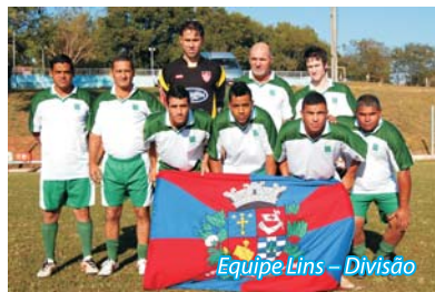
Equipe Lins - Divisão