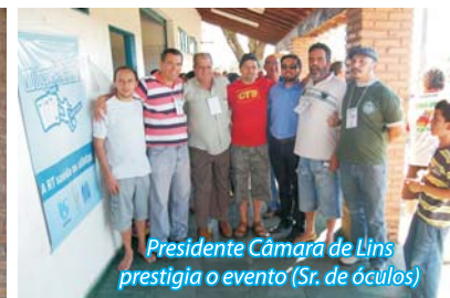
Presidente Câmara de Lins prestigia o evento (Sr. de óculos)