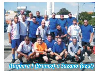
Itaquera I (branco) e Suzano (azul)