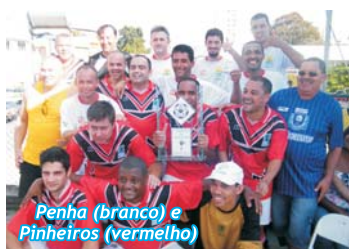
Penha (branco) e Pinheiros (vermelho)