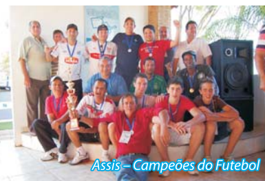
Assis - Campeões do Futebol