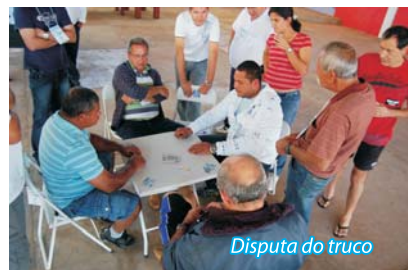
Disputa do truco