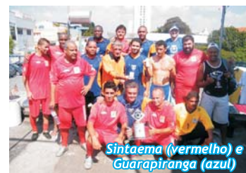
Sintaema (vermelho) e Guarapiranga (azul)