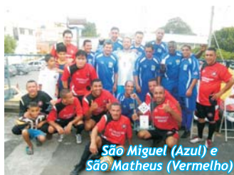
São Miguel (Azul) e São Matheus (Vermelho)