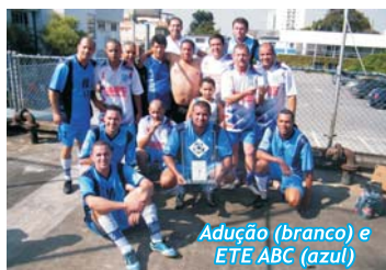
Adução (branco) e ETE ABC (azul)

No final dos jogos, foi oferecido um churrasco onde cada um adquiria o seu espetinho por R$ 2,00, ao som do grupo de samba “Off Set”, que agradou a todos e levou as pessoas a sambarem muito. //