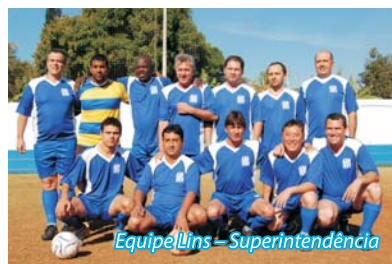
Equipe Lins - Superintendência