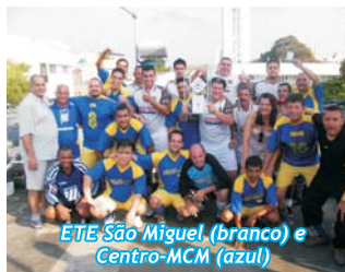
ETE São Miguel (branco) e Centro-MCM (azul)