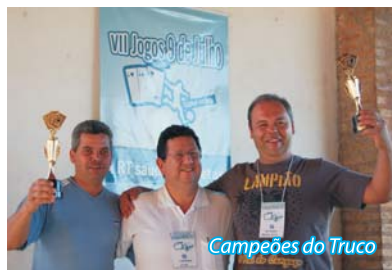
Campeões do Truco