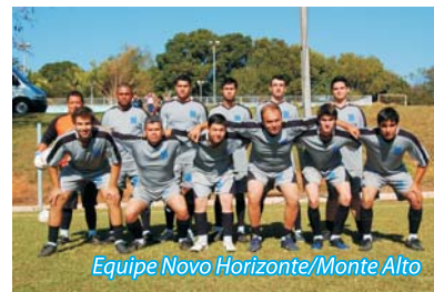
Equipe Novo Horizonte/Monte Alto