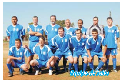
Equipe de Jales