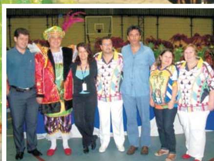
Diretores da Associação foram prestigiar o aquecimento dos passistas no "esquentar" da Ponte Pequena