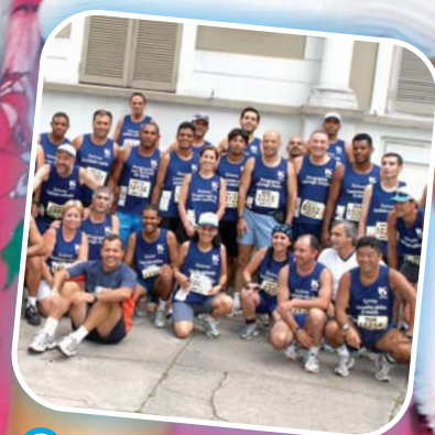
Os nossos atletas da São Silvestre