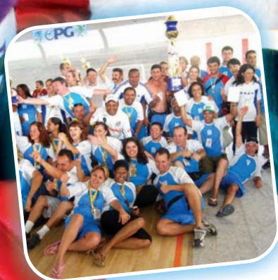
O sucesso da VII Olimpíada Geral