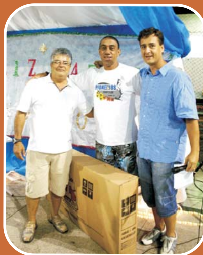
Premiação da bicicleta