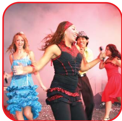
High School Musical Cover